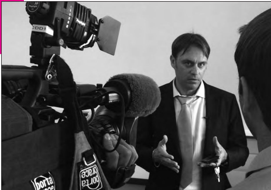
Le directeur de l'IUT di Corsica se livre aux questions de nos confrères de France 3 Corse/Via Stella