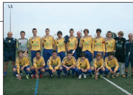
Une équipe en devenir