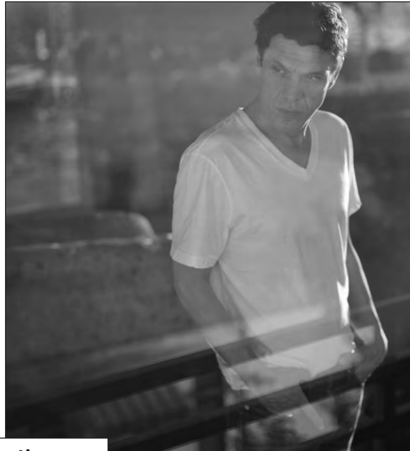
Marc Lavoine, attendu pour un concert acoustique

Grâce à l'éclectisme assumé, la programmation s'adresse encore et toujours à tous les publics. Elle joue la diversité des lieux et des horaires, avec la volonté profonde de maintenir la qualité et l'équilibre artistiques entre ce qui est connu et moins connu. La Fabrique de Théâtre - site européen de création - reçoit l'opération Sud In Musica pour une véritable éclosion de talents. Les participants reçoivent des prix décernés par trois jurys (Professionnels, Jeunes et Public) et le lauréat de l'année précédente revient à Bastia sur la grande scène du théâtre (c'est Karimouche ). Les Musicales , c'est la rencontre d'artistes avec le public scolaire, d'artistes amateurs et professionnels; c'est aussi une master