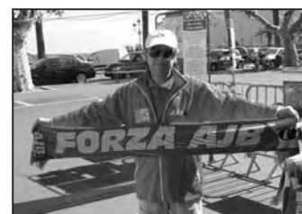
Sur le stand de l'AJB, lors de la fête du Sport 2010 à Bastia

L'athlétisme aussi est présent dans le secteur sud de Bastia, plus exactement à Montesoru dont le stade accueille ce sport que l'AJB nous donne tant envie de pratiquer. C'est une excellente idée que celle de prendre sa licence à l'Athlétic Jeunes Bastia. Ses responsables, dirigeants, entraîneurs, secrétaires, se dépensent sans compter, leur disponibilité est sans failles, et leur passion et leurs résultats ont fait du club le premier en Corse et le seul club corse, toutes disciplines confondues, à évoluer en Elite Nationale et Internationale de la catégorie cadets à celles de vétérans.