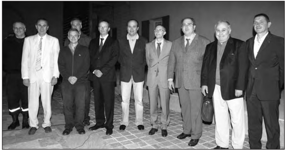
Les officiels, lors de la Cérémonie au couvent Saint François

La clôture de saison des feux de forêt constitue un moment important de la vie du SDIS (Service Départemental d'Incendie et de Secours). Cette cérémonie marque l'heure des bilans et des prospections d'avenir. Elle est aussi l'occasion de réunir, dans une ambiance qui se veut conviviale, l'ensemble des acteurs qui ont contribué à la campagne feux de forêt.