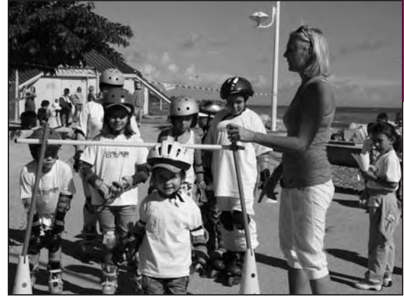
Roller et dose de bonne humeur pour la fête du sport à Moriani-Plage

Sport en fête se veut un événement festif et fédérateur destiné à favoriser les rencontres entre la population, les associations et les institutions oeuvrant dans les domaines sportifs et culturels en Costa Verde . Tous les acteurs de ce dimanche sportif se sont accordés à vanter