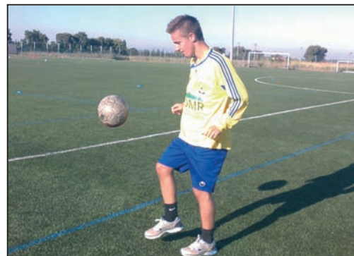
Sur le terrain, le joueur en action : défense solide et bonne technique

J'ai d'ailleurs été surpris par le travail sérieux des garçons mais aussi par les installations du stade Paul Tamburini.