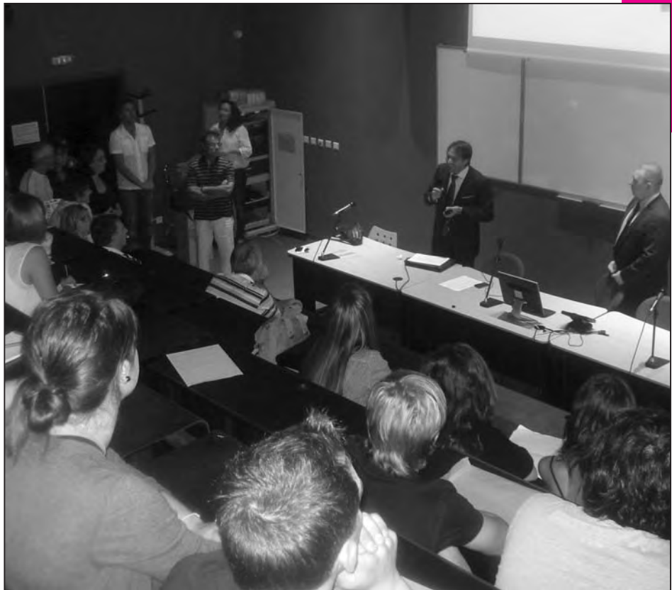
Traditionnelle grand-messe de rentrée en l'amphi Ghjuvan'Battista Acquaviva de l'IUT di Corsica, en présence du directeur d'établissement, des personnels enseignants et administratifs ainsi que des nouveaux étudiants

Ce lien est permanent et très fort. Je vous rappelle que la vocation première de l'IUT est de répondre, par le biais de ses formations, aux besoins du tissu socio-