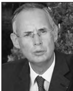
Le Préfet de Corse Stéphane Bouillon

La président a pour sa part adressé un message : celui de voir tous les acteurs se mobiliser pour le brûlage dirigé. La politique régionale de prévention des incendies prend plus que jamais en compte l'intérêt du brûlage dirigé et la campagne des feux de forêt achevée, la prévention reprend ses droits. Message partagé par le préfet Jean-Luc Nevache pour qui l'objectif se situe au millier d'hectares par an.